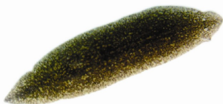
Figura 4 – Exemplar de Girardia tigrina adulta

À medida em que o animal vai crescendo a faringe passa a se localizar na região mediana do corpo.