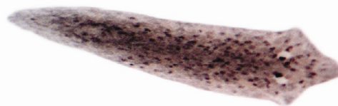
Figura 4 – Exemplar de Girardia tigrina recém eclodida da cápsula de ovo.

Os animais recém nascidos (Figura 4) apresentavam a mesma morfologia do animal adulto (Figura 5), porém com pigmentação mais clara. O poro genital ainda não está desenvolvido e o poro faringeal está localizado próximo da região caudal.