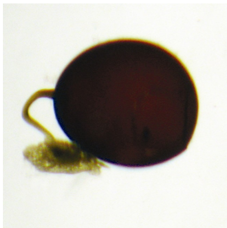
Figura 3 – Cápsula de ovo fixado em um substrato com o auxílio de um pedúnculo da espécie Girardia tigrina .

média do comprimento dessas cápsulas foi de 1,08 mm \pm 0,05.